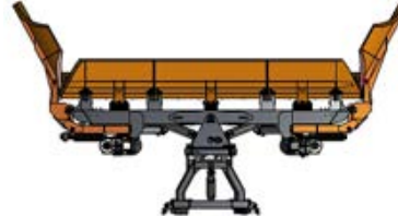
gerade Auswurfsperrre unten und oben