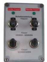
SPS oder Einfache Steuerung