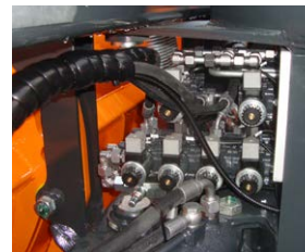
Hydraulikblock für Steuerung am Schneepflug