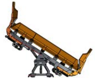
diagonal rechts-links Auswurfsperrre unten

Hydraulikzylinder für Auswurfsperrre Seitenverstellung