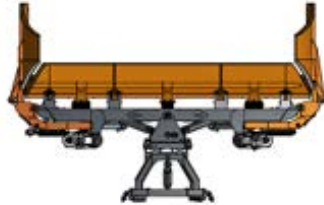
gerade Auswurfsperrre unten