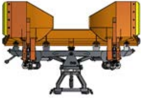
gerade Auswurfsperrre oben