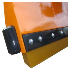
Eingelegte PU-Schürfleiste mit Anstellwinkel 25°