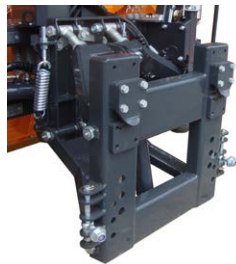
Kommunale Anbauplatte mit einstellbarer oberer Gabel