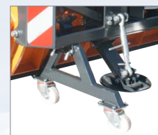
Abstellwagen zum einfachen Abstellen und Rangieren im abgehängenen Zustand