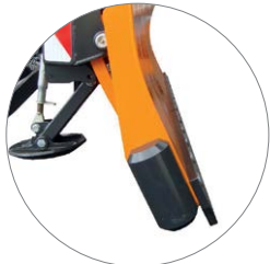
Aggressiver Anstellwinkel 25°