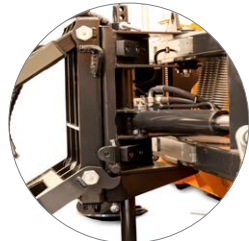
getrennte Hebe- & Schwenkeinrichtung