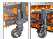
Laufrollen (Vollgummi oder Luftbereift)