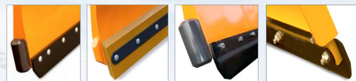
Stahlschürfleiste PU-Schürfleiste Kombischürfleiste Dämpfungsschiene